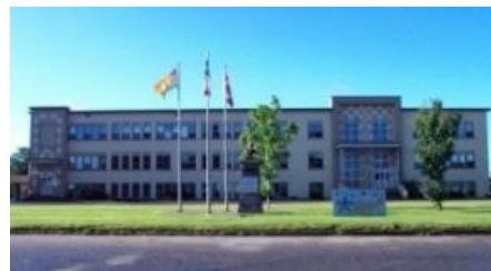
Centre de bénévolat de la Péninsule acadienne

À l'heure actuelle, il y a un grand nombre de services qui sont offerts par le secteur communautaire sans but lucratif. Cette activité représente des millions de dollars en fonds publics, investis par le gouvernement du NB. (8) À titre d'exemple, le Centre de Bénévolat de la Péninsule Acadienne inc. a reçu, en 2008, 4 146 599 $ pour dispenser de nombreux services sociaux communautaires. Une fois le Plan mis en branle, le gouvernement a l'intention de refiler encore plus de services (inclusion de la main-d'œuvre, alphabétisation, mentorat) au secteur communautaire sans but lucratif. Ce secteur prendra en outre de nouvelles responsabilités telles que le transport communautaire, le développement économique communautaire, les initiatives à caractère social et certains aspects de l'habitation.