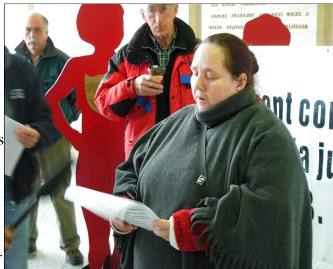
Membre du Front commun réclamant un supplément de chauffage

En septembre 2009, le FCJS a réclamé que le document « Document sur les options », issu des Tables rondes, soit rendu public. Vingt-quatre organismes du NB ont signé une lettre ouverte adressée au Premier ministre Graham, l'enjoignant de rendre ce document public (4).