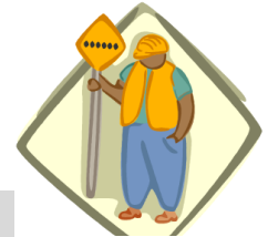
Accent mis SUR le travail

Cette vision laisse croire que si un individu est prestataire d'aide sociale en raison de limitations physiques ou émotionnelles, il doit faire une contribution quelconque en retour du chèque qu'il reçoit . Le Plan reste muet par rapport aux assistés sociaux qui sont inaptes au travail. Il n'offre aucun moyen concret de les sortir de la pauvreté.